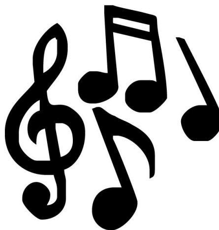
интервью подготовил Константин ЛИЦИН

Вот какие студенты учатся в нашем филиале — целеустремленные, талантливые и активные. Хотелось бы, чтобы их было больше и они приносили славу институту.