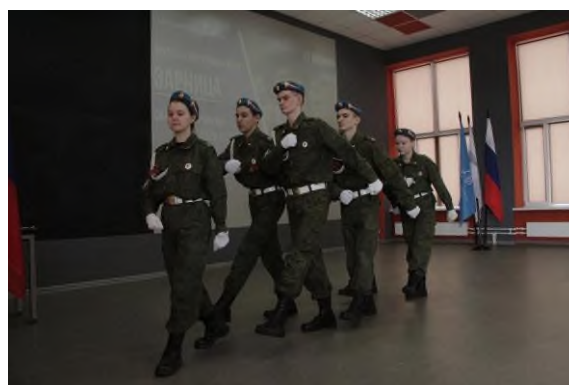
Военно-спортивная игра «Зарница».