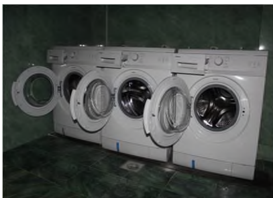
Общежитие НФ НИТУ «МИСИС»

Все здания филиала приведены в соответствие с требованиями пожарной безопасности, смонтированы АПС и СО (обслуживание АПС ведется специализированной организаци-