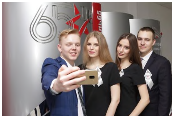
«Юбилей АО «Уральской Сталь»»

В филиале проводится большая работа по формированию правовой культуры студентов: профилактические беседы и кураторские часы по противодействию коррупции, экстремизму и терроризму, диспуты и встречи с представителями прокуратуры и силовых структур.