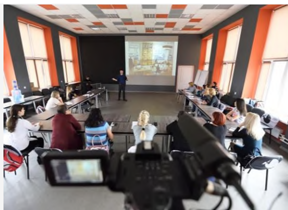
«Менеджмент в культурной сфере: стратегия успеха» АРТ- ОКНО