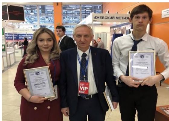
«Международная выставка «МЕТАЛЛ-ЭКСПО» г. Москва

В ноябре 2019 г. в г. Москва проходила 25-я Международная промышленная выставка «Металл-Экспо». В выставке приняли участие студенты 3-4 курса, которые были награждены премией и дипломами лауреатов конкурса «Молодые ученые».