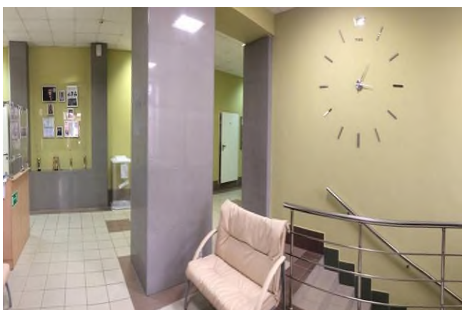
Холл здания №1 НФ НИТУ «МИСиС»

В целях организации доступной среды для студентов с инвалидностью или ОВЗ из категории маломобильных групп населения в здании корпуса 1 структурные подразделения, взаимодействующие непосредственно со студентами, были переведены на 1 этаж, произведен соответствующий ремонт. В корпусе № 2 и здании общежития организована безбарьерная среда - произведены необходимые изменения и ремонт крыльца.