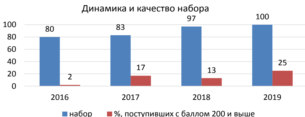
Рисунок 1 – Динамика количества и качества набора

Средний балл обучающихся, принятых по результатам ЕГЭ и дополнительных испытаний за счет бюджета в 2019г. – 65,05. На бюджетные места зачислялись студенты, имеющие суммарный балл ЕГЭ не менее 170 баллов. Средний балл ЕГЭ на очной форме обучения по всем категориям абитуриентов в 2019 году – 63,3 балла.