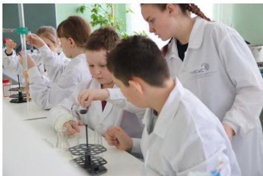
«Химия не по-детски»

Новотроицкий филиал не только центр подготовки кадров, но и является социокультурным центром города. Более 20 тысяч человек ежегодно учувствуют в мероприятиях, проводимых под эгидой филиала, города и АО «Уральская сталь».