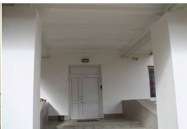
Входная группа корпуса общежития

Стоимость основных фондов филиала по итогам работы в 2019 г. – 58423 тыс. руб.(наблюдается увеличение по сравнению с 2018 годом) Стоимость машин и оборудования – 23998,2 тыс. руб., в т.ч. стоимость оборудования не старше 5 лет составляет 5389,5 тыс.