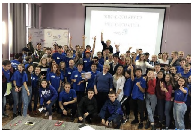
Адаптационное мероприятие «Погружение»

Для поощрения кураторов групп в НФ НИТУ МИСиС разработано «Положение о кураторской работе». Большое внимание уделяется адаптации студентов 1 курса. С первых дней пребывания в вузе первокурсники вовлекаются в культурно-массовую, научную, общественную и спортивную деятельность вуза. Этому способствует мероприятие «Посвящение в студенты», которое проводится в форме квеста. Здесь же студенты первого курса презентуют свою группу и идут «Тропой первокурсника».