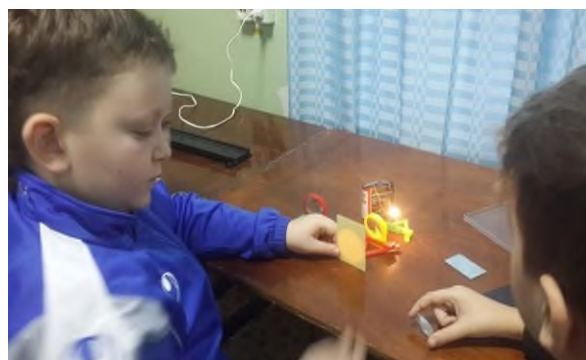
«Физика в твоих руках»

Не первый год на базе НФ НИТУ «МИСиС» организуется Всероссийский фестиваль научного кино «ФАНК», Всероссийская контрольная «Выходи решать», проекты культурной платформы АРТ-ОКНО.