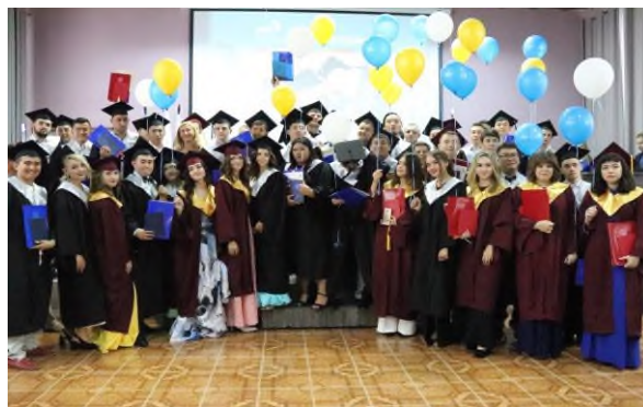
«Вручение дипломов выпускникам»