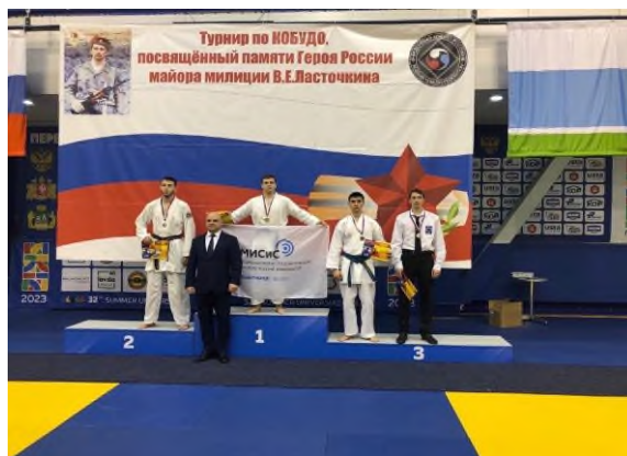
«Всероссийские спортивные соревнования»

Таким образом, воспитательная система, реализуемая в НФ НИТУ «МИСиС» доказала свою эффективность благодаря сохранению традиций, которые были заложены в филиале и реализации новых социально-значимых инициатив молодежи, направленных на создание в городе и регионе единого образовательного пространства благополучия, духовности и безопасности.