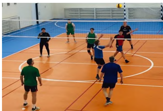
«Спартакиада по волейболу»