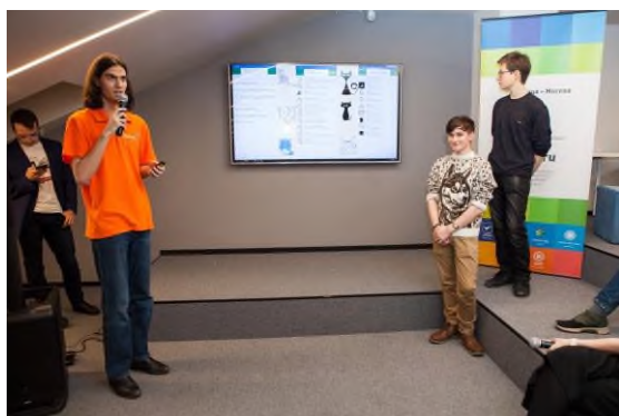
Хакатон «Прожектор 2020»

В марте 2020 г. студенты 2-3 курса участвовали в отборочном этапе Международного чемпионата по технологической стратегии «Metal Cup 2020. Gold season». По результатам отборочного этапа две команды НФ НИТУ «МИСиС» отправятся на полуфинал чемпионата «METAL CUP».