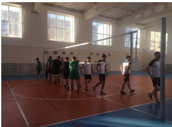
«Первенство по волейболу МИСиС»