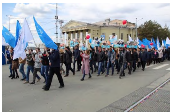
«Демонстрация 1 мая»