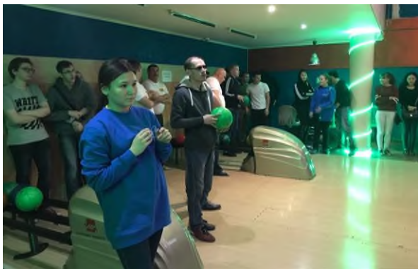
«Межмуниципальный чемпионат по боулингу»