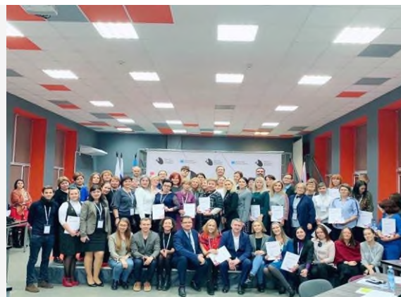
«Проектировочная сессия» СКОЛКОВО

Для организации гражданско-патриотического воспитания НФ НИТУ «МИСиС» использует различные формы работы: военно-спортивные конкурсы, встречи с ветеранами Великой Отечественной войны и труда, участниками локальных войн и воинами- интернационалистами, конференции и круглые столы, квесты, десанты, концерты, экскурсии по историческим местам и др.