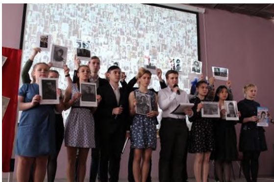
«Мы будем помнить»

В филиале сформировался традиционный цикл культурно-массовых мероприятий: «Погружение», «День самоуправления», «День студента», «Гатьянин день», «День открытых дверей», «День знаний», военно-спортивная игра «Зарница», вечер «Вручение дипломов выпускникам», «День науки».