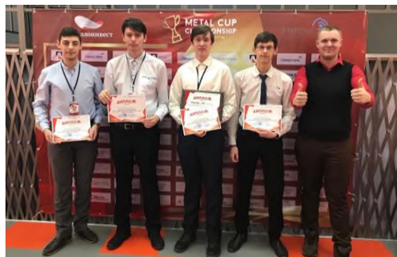
«Metal Cup 2020. Gold season»

В соревнованиях среди студентов вуза и средних учебных заведений города: Зимние студенческие игры», «Презентация специальностей», организованных компанией «Металлоинвест», Спартакиада АО «Уральская Сталь» студенты филиала показывают себя достойно, занимая множество призовых мест. Так, в феврале студент 2 курса привез филиалу и городу четыре всероссийские награды за 1 и 2 места по восточному боевому единоборству.